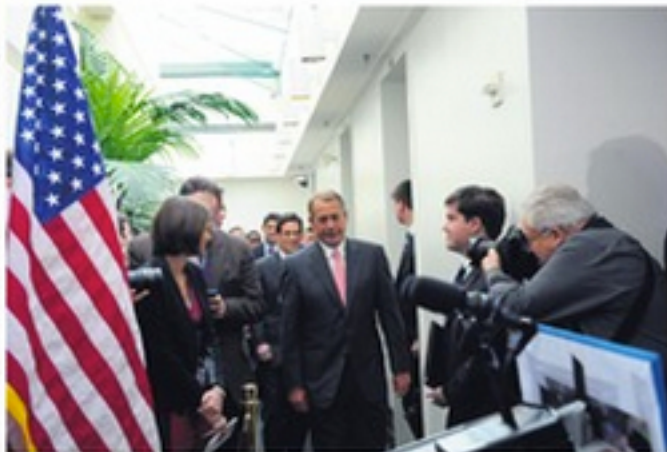
Republikeinenvoorman John Boehner kraakte tijdens zijn overnamepartijgenoten. "De middelen het ook."

Bij het voorstel Afdeling wisten voorlopig algevoel. Ook zegt hij er voor dat de automatische bezuinigingen en belastingverhogingen van zo'n $10 miljard, die vooral Defensie