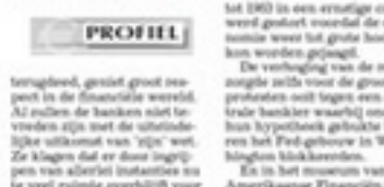
Paul Volcker wil banken weer aanpakken.

De Amerikaanse financiële wereld is de laatste jaren in een enorme schok terecht gekomen. De Amerikaanse financiële wereld is de laatste jaren in een enorme schok terecht gekomen. De Amerikaanse financiële wereld is de laatste jaren in een enorme schok terecht gekomen.